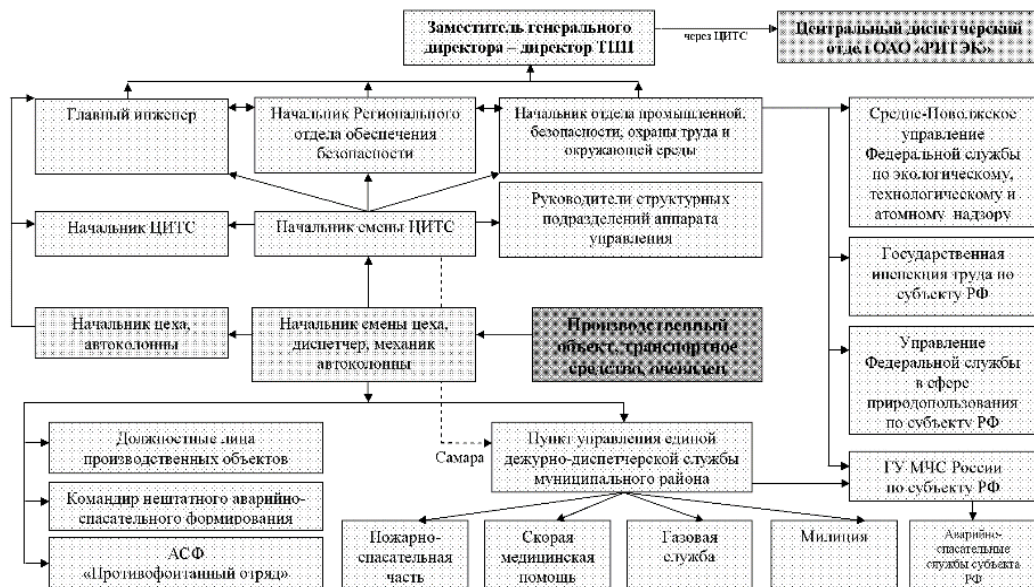
СХЕМА передачи информации при угрозе возникновения и возникновении аварий, катастроф, пожаров, взрывов, инцидентов и несчастных случаев на производственных объектах ТПП «РИТЭК-Самара-Нафта»

Персонал по обслуживанию проектируемых сооружений, и ремонтные бригады снабжены сотовыми телефонами, с использованием которых, в случае необходимости, возможна передача информации и распоряжений (сигналов) ГО.